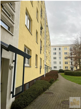
Ansicht Haus Innenhof