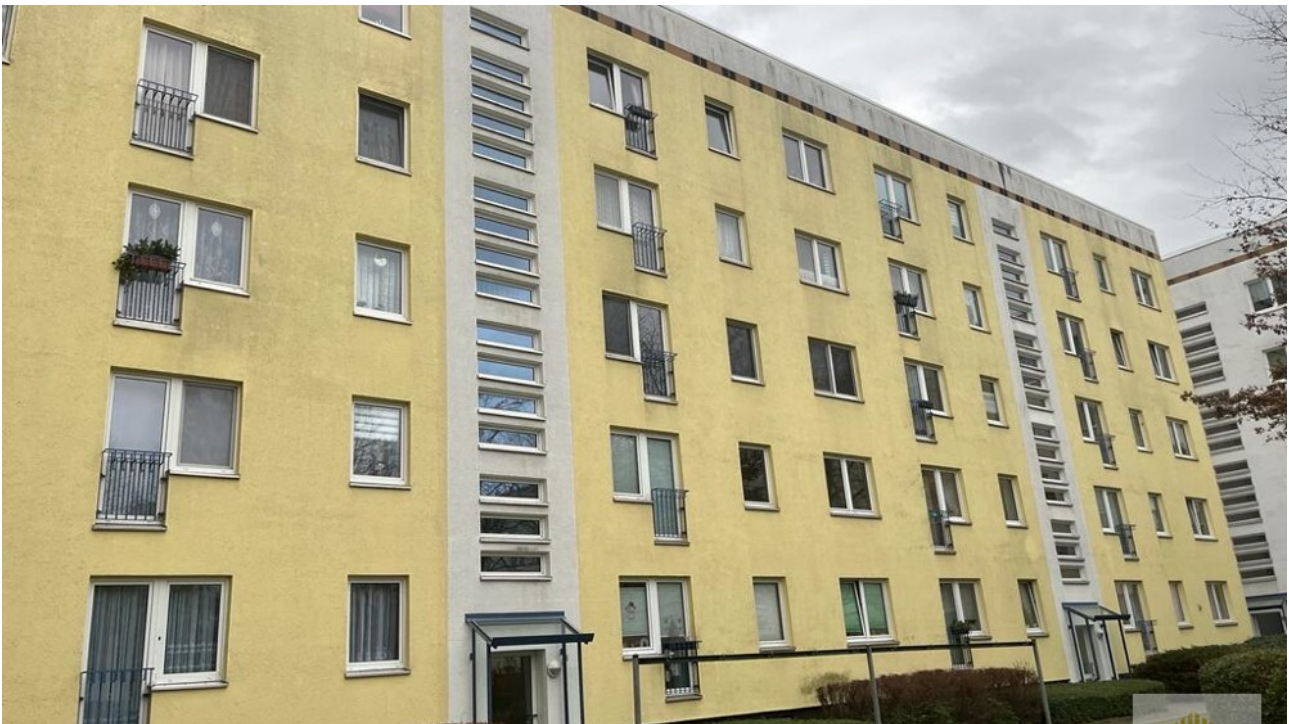
Ansicht Haus Innenhof